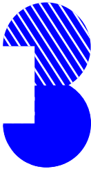
Bouée des jeunes - Musée des beaux-Arts Cambrai